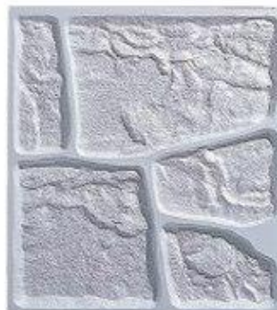
■化粧型枠 サイズ：1000 × 1118